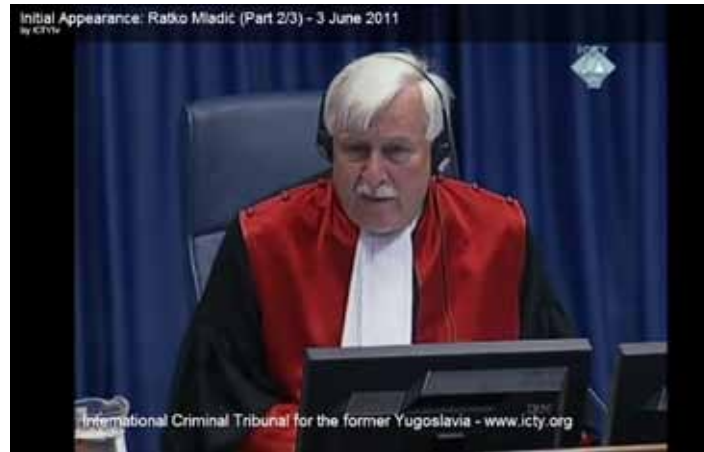
Screenshot van de Servische televisie met rechter Orie.

Het proces tegen Ratko Mladic gaat vandaag gewoon beginnen. Het wrakingsverzoek van de voormalige Bosnisch-Servische legerleider tegen de Nederlandse VN-rechter Alphons Orie, voorzitter in zijn proces, en een verzoek om uitstel zijn afgewezen. Volgens rechter Theodor Meron, de voorzitter van het Joegoslavië-Tribunaal, heeft Mladic niet aannemelijk gemaakt dat de Nederlandse rechter vooringenomen is.