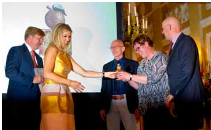
Beheerders historische perenbomenrij Gasselternijveen onderscheiden.

Prins Willem-Alexander en prinses Máxima hebben voor de tiende keer de Appeltjes van Oranje uitgereikt op paleis Noordeinde in Den Haag. Nooit eerder deed het beschermbaar van het Oranje Fonds dat gezamenlijk. In de afgelopen tien jaar kregen dertig sociale initiatieven al een Appeltje van Oranje. Daarvan zijn 25 nog steeds actief. Het Oranje Fonds belooft met de