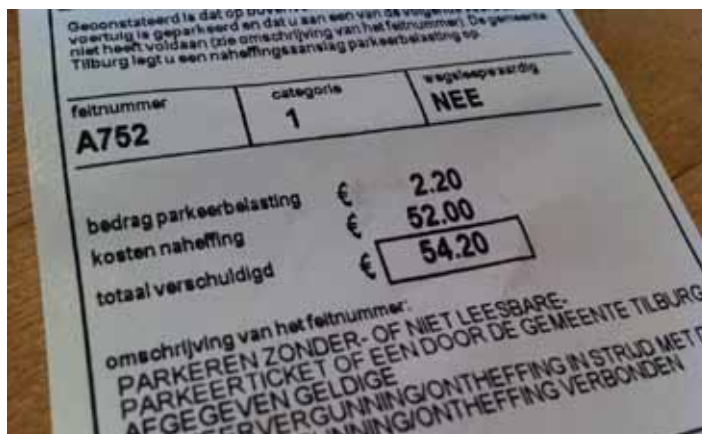
Politie gaat weer gewoon bonnen uitschrijven.

De politiebonden schorten hun acties op en gaan de cao-onderhandelingen met politiewerkgever minister Ivo Opstelten hervatten. Ook de terughoudendheid met het schrijven van bekeuringen wordt gestaakt. 'De politievakbodem en de minister hebben er vertrouwen in dat verdere onderhandelingen kunnen lei-