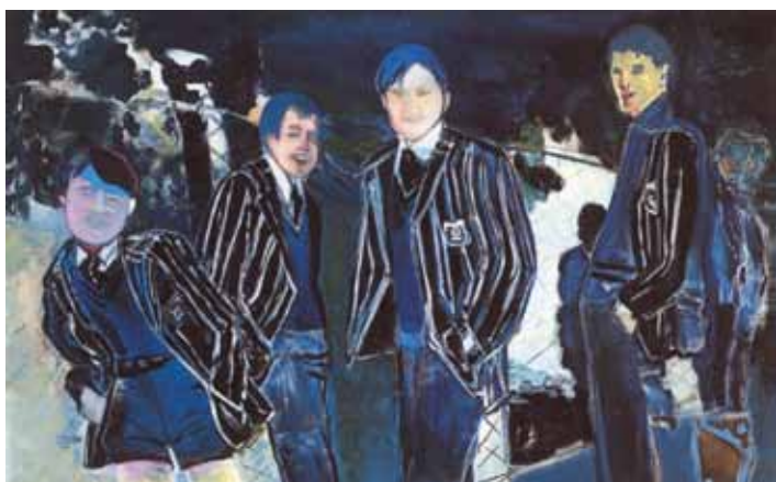
Werk van Marlene Dumas; 'The Schoolboys 1987'.

Als je in het buitenland naar een tentoonstelling wilt gaan van een echt goede Nederlandse kunstenaar, kun je de Top-100 raadplegen van Elsevier. Het tijdschrift maakt sinds zeven jaar een ranglijst van levende Nederlandse kunstenaars die het meest gerenommeerd en zichtbaar zijn in het buitenland.