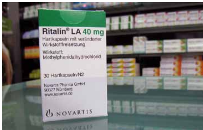
Ritalin is in sommige landen verboden.

Het komt geregeld voor dat Nederlanders op vakantie in de problemen komen, omdat ze medicijnen meenemen die elders verboden zijn. 'Vaak weten mensen niet dat ze een vergunning nodig hebben en staan ze bij een controle met hun mond vol tanden', zegt apothekerskoepel KNMP. In veel geneesmiddelen zitten stoffen die onder de Opiumwet vallen. Het is niet zo dat toeristen in de cel belanden, maar het kan wel voor flinke vertraging zorgen bij bijvoorbeeld de