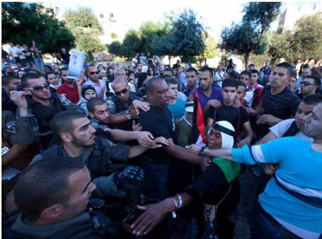
Verhitte gemoederen in Oost-Jeruzalem.

Op diverse plaatsen is onrust ontstaan in verband met de stichtingsdag van Israël. Palestijnse demonstranten zochten de confrontatie met het leger.