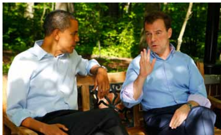
President Obama en zijn Russische collega Medvedev eerder dit jaar.

Door het bloedbad in de Syrische stad Houla, waarbij volgens de VN-missie 116 mensen omkwamen, doet de internationale gemeenschap opnieuw pogingen de explosieve situatie in het land onder controle te krijgen. Zo zouden er weer plannen worden gesmeed president Bashar al-Assad netjes weg te krijgen. Volgens de New York Times werkt de Amerikaanse president Barack Obama aan