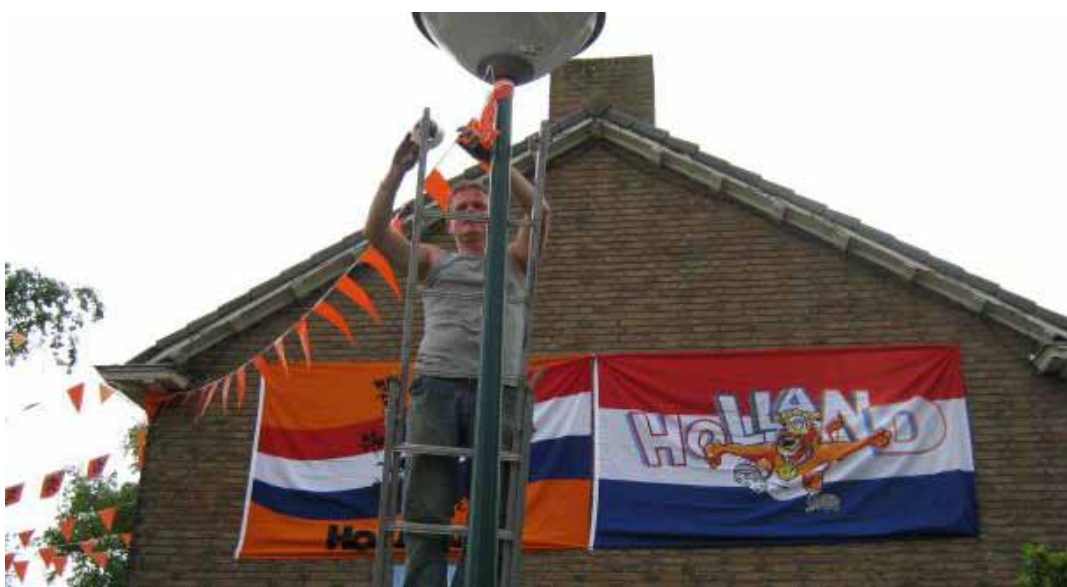
Een man versiert zijn huis en straat voor het EK-voetbal.

Plaatselijke brandweerkorpsen gaan voor en tijdens het EK Voetbal steekproefsgewijs versieringen in kroegen, buurten clubhuizen controleren. Ook uitbundig versierde straten krijgen mogelijk een bezoek van de brandweer.