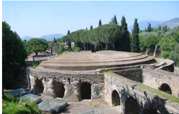
De restanten van de Villa van Hadrianus in Tivoli nabij Rome.

De Italiaanse regering heeft een project opgegeven om nabij de Villa van Hadrianus een stortplaats in open lucht aan te leggen. De villa, die toebehoorde aan de beroemde tweede eeuwse Romeinse keizer is al haast even beroemd als diens Muur, en is een trekpleister voor toeristen en historici. Het project om een stort naast de ruïne aan te leggen, zorgde voor fel protest. Probleem is dat het centrum voor het sorteren van het afval van de Romeinen, de site van Malagrotta, zijn maximumcapaciteit aan het bereiken is.