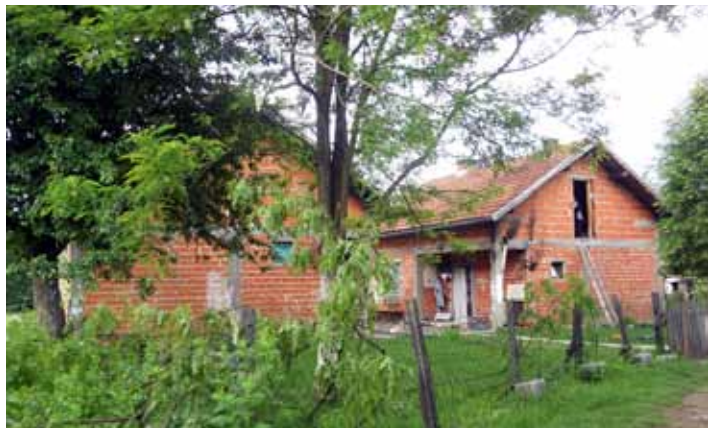
Het huis waar het Duitse meisje jarenlang werd vastgehouden.