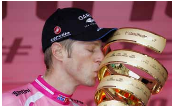
Ryder Hesjedal viert de overwinning in de Giro d'Italia.

De Canadese wielrenner Ryder Hesjedal heeft de Ronde van Italië gewonnen. De renner van Garmin-Barracuda was in de slotetappe, een tijdrif over ruim 28 kilometer, duidelijk sneller dan de in de roze leiderstrui gestarte Spanjaard Joaquim Rodriguez. De Belg Thomas de Gendt, zaterdag winnaar op de Stelvio, legde beslag op de derde plaats in het eindklassement. De laatste