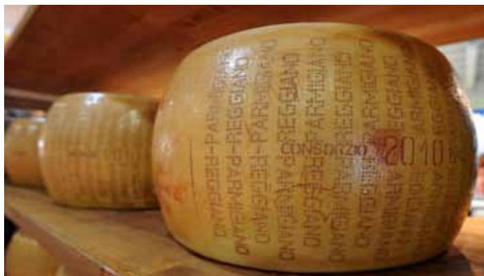
Grana Padano kaas hier wel keurig in de rijpschappen.

Vele tienduizenden Parmezaanse kazen die zijn beschadigd door de aardbeving in Italië, krijgen een nieuwe bestemming. De fabrikanten hebben bedacht om ze te laten smelten tot smeltkaas. Bij de aardstok vorige week in het noorden van Italië zijn bij Parma circa 300.000 Parmezaanse kazen beschadigd. Ook ongeveer 100.000 kazen van de vergelijkbare Grana Padano