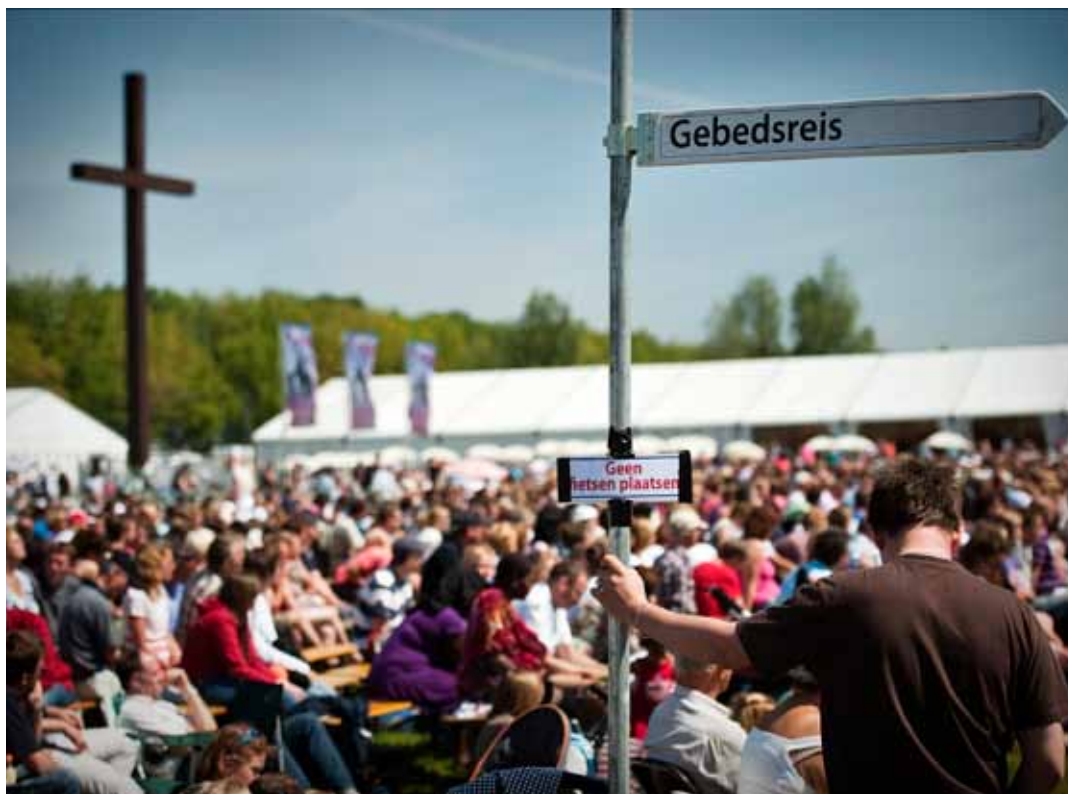
Massaal gebed op het evenemententerrein in Biddinghuizen.

Ruim 50.000 christenen hebben Pinksteren gevierd op de festivalterreinen van Biddinghuizen in Flevoland. Het is de 42e keer dat de pinksterconferentie Opwekking wordt gehouden.