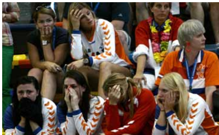
Deceptie op de tribune nadat de olympische droom is geëindigd.

De Nederlandse handbalsters mogen opnieuw niet meedoen aan de Olympische Spelen. De ploeg van bondscoach Henk Groener won bij het kwalificatietoernooi zelf met 31-20 van Argentinië, maar Kroatië versperde Oranje de weg naar Londen. De Kroatische vrouwen waren in het laatste duel in Guadalajara met 23-22 te sterk