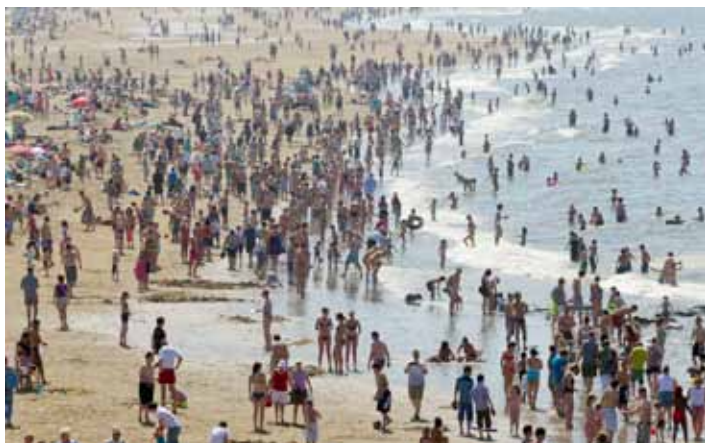
Topdrukke op het strand van Scheveningen.

Het stralende weer in Nederland heeft gezorgd voor topdrukke op de stranden. Ook werden de vele evenementen in het land druk bezocht.