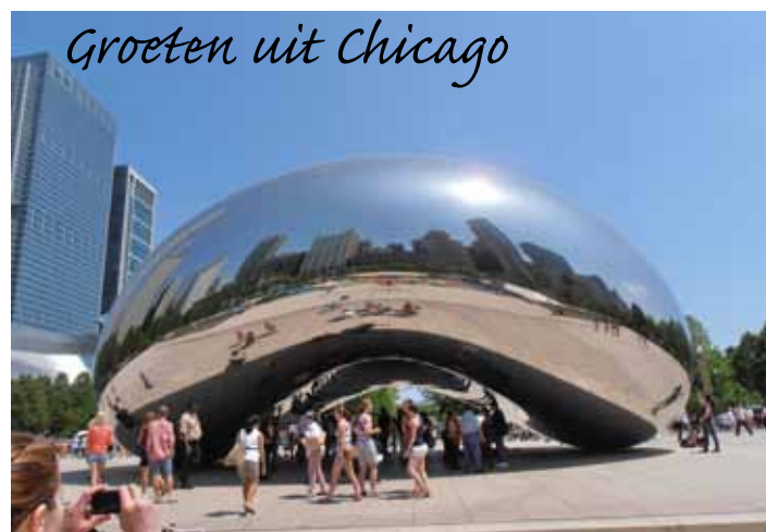
Groeten uit Chicago

Daardoor werd gedacht aan het aanleggen van een nieuw stort in Corcolle, nabij de Villa, die in 1999 door Unesco werd uitgeroepen tot werelderfgoed. Op het internet had een petitie onder de naam 'Laat ons de Villa van Hadrianus redden' op enkele dagen meer dan 6.000 handtekeningen verzameld, waaronder die van een reeks bekende historici en archeologen. De Villa van Hadrianus, die zich over een oppervlakte van 80 hectare uitspreidt, ligt in een vlakte in Tivoli, op 23 kilometer van de Italiaanse hoofdstad.